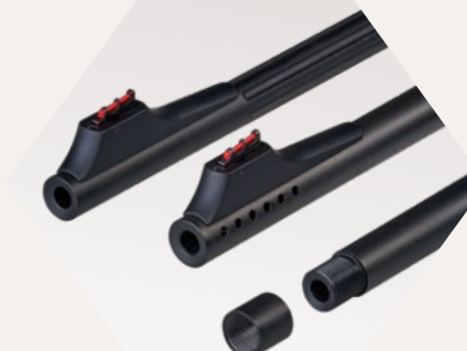
LAUFOPTIONEN Laufkannelierung, Laufpor- tung, Mündungsgewinde