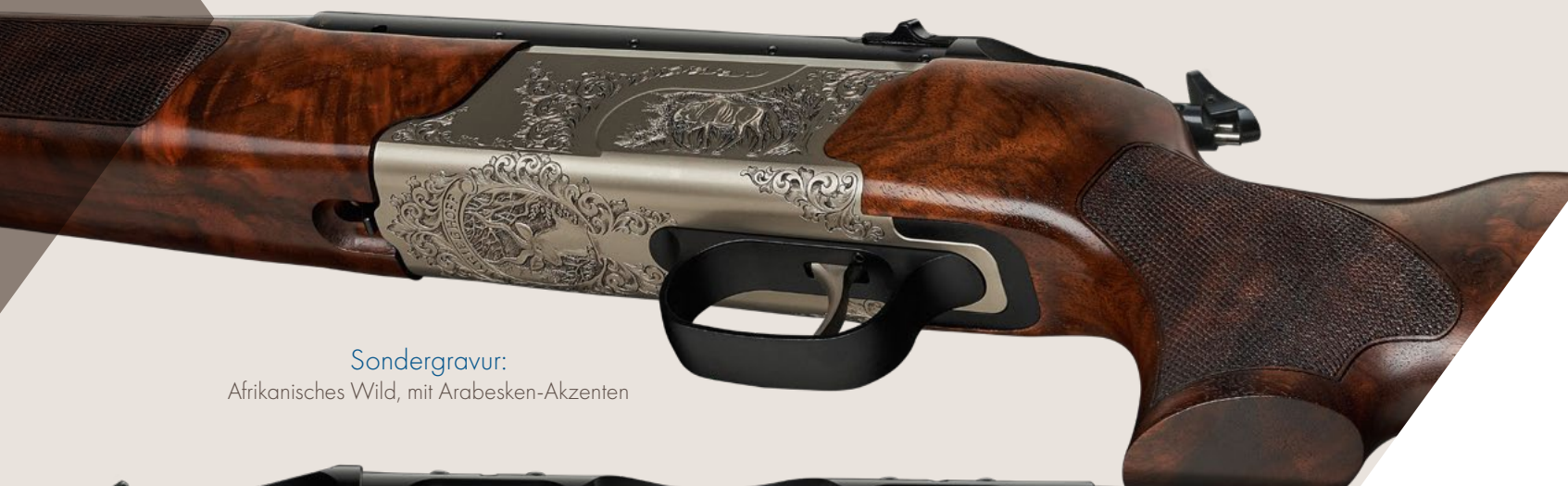
Sondergravur: Afrikanisches Wild, mit Arabesken-Akzenten

Charakter und Individualität können einer Waffe durch eine Gravur verliehen werden. Wählen Sie aus einer unserer Gravurvarianten oder gestalten Sie in Zusammenarbeit mit unseren Graveuren ein komplett einzigartiges Design.