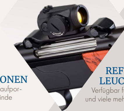
REFLEX-/ LEUCHTPUNKTMONTAGE Verfügbar für Aimpoint, Docter Sight und viele mehr.