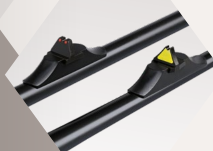
VISIERUNG Verschiedene offene Visierungsmöglichkeiten