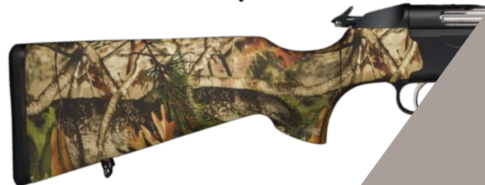
ABBILDUNG: Lochschaft mit Camo-Finish "Blaze Orange" Schaft mit Camo-Finish "Forest Green"