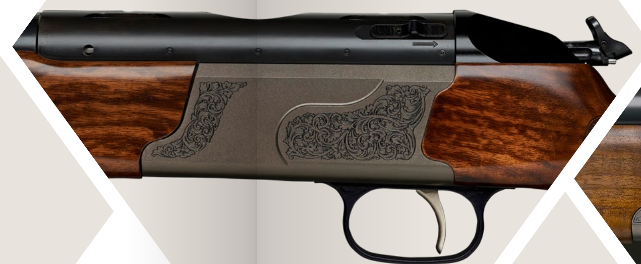
Gravurvariante: „Kleine Arabesken“

Weitere Infos zum Thema Gravuren finden Sie auch unter www.krieghoff.de/gravuren