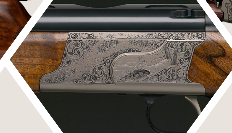
Sondergravur: Fein gestochenes, flächendeckendes Jagdmotiv mit Blattarabesken