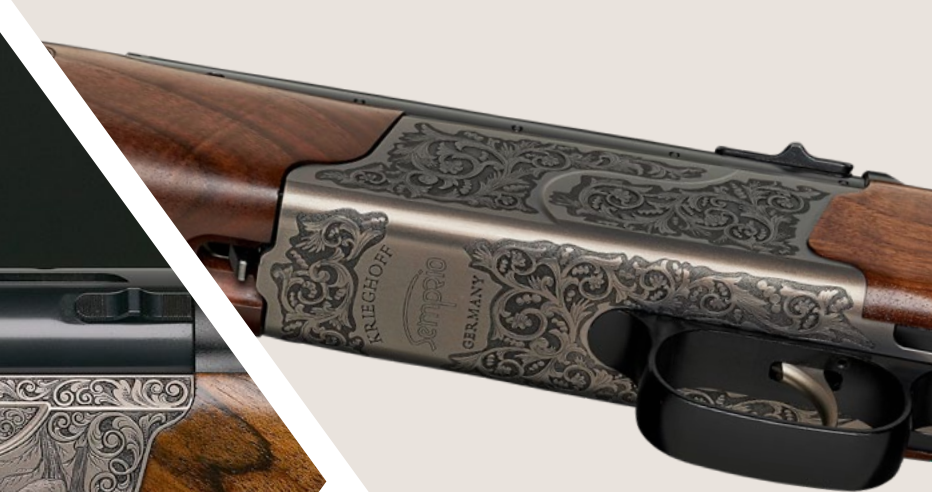
Sondergravur: Kräftiges Blattarabesken-Ornament