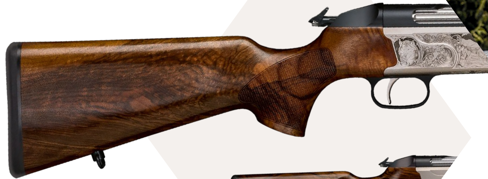
ABBILDUNG: Schaft mit Sempriobacke Lochschaft mit Sempriobacke